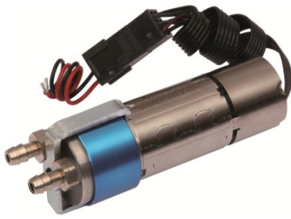
Abbildungen/Daten/Diagramme unverbindlich Illustrations/Dates/Graphs without engagement