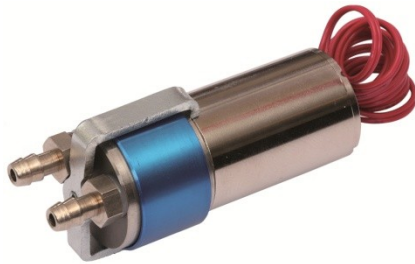
Abbildungen/Daten/Diagramme unverbindlich Illustrations/Dates/Graphs without engagement