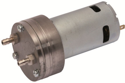
Abbildungen/Daten/Diagramme unverbindlich Illustrations/Dates/Graphs without engagement